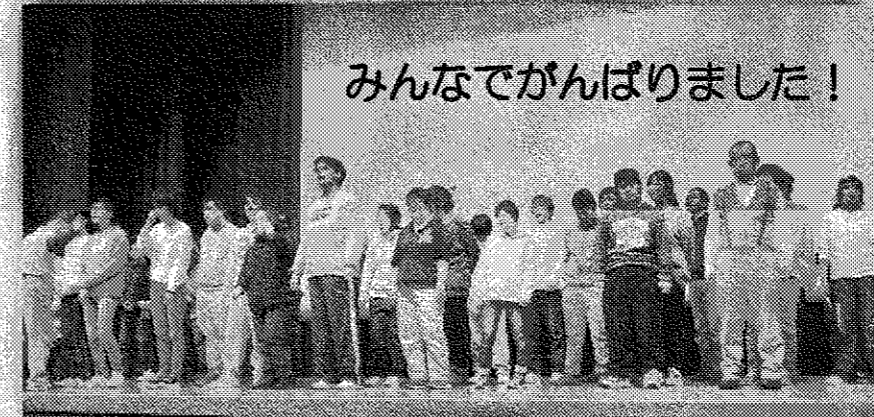
みんなでがんばりました!

今年度は冷え込みも少なく、過ごしやすい気候の中、2月11日(火)祝日、映画会を開催しました。 400名を超えるたくさんの方に来場していただき、上映の前には上京ワークハウスの仲間たちの「翼をください」の歌を披露して、心温まる映画会となりました。