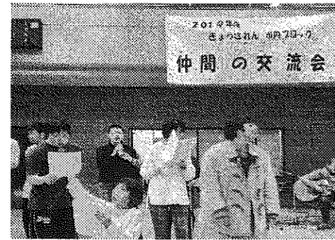
2019年度 きょうされん 市内ブロック 仲間の交流会

2月7日(金)京都市障害者スポーツセンター体育館にて開催された、「2019年度きょうされん市内ブロック仲間の交流会」に参加してきました。 毎年、きょうされん加盟の事業所が集って体を動かし、文化交流をはかる取り組みです。