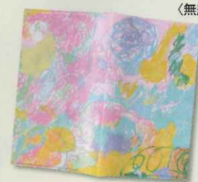
「無題」 清水 啓介 (ハピバル/大阪府)